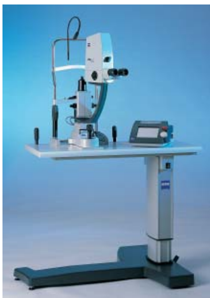
ビズラス ヤグ III