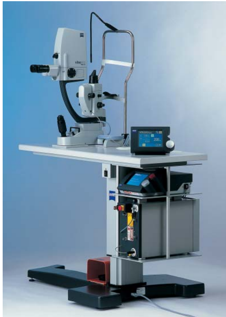
レーザコンソールをテーブルに収納した省スペース、ハイパフォーマンス器です。 ※写真はスタンダードタイプです。日本仕様のスリットランプはトラディショナルツァイスグレーで統一されます。

乱視、照射部位のゆがみなどレーザビームのロスが予測でき、より適切なレーザ治療が行えます。